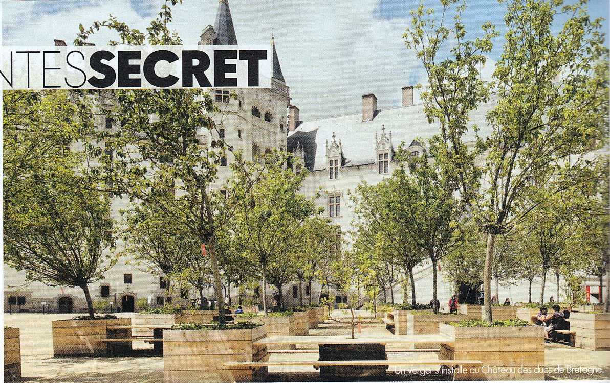
Un verger s'installe au Château des ducs de Bretagne.